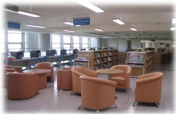
圖書館內部(校園環境)