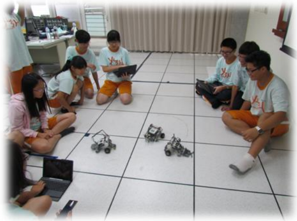
科學專題課程(機器人設計)