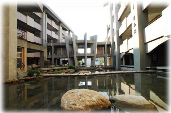
梯田生態池(校園環境)