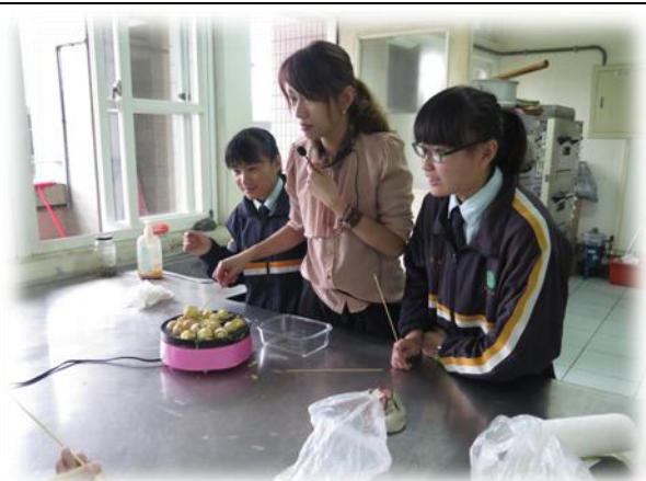
多元選修日文體驗課程