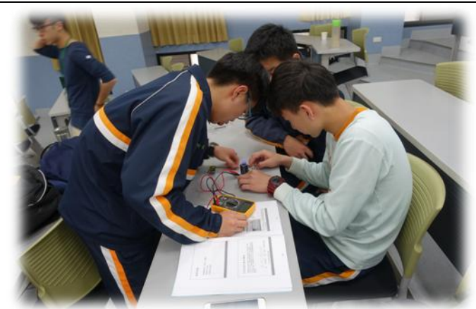
大學參訪實作課程