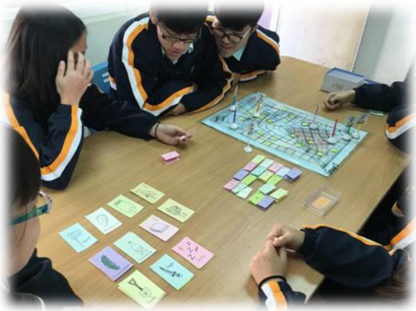
英文專題課程(桌遊設計)