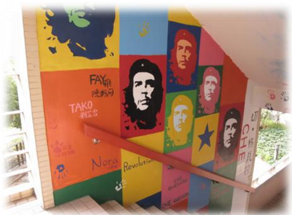
美術班學生彩繪樓梯