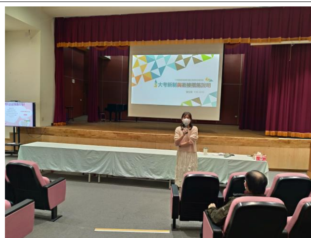
大考制度與升學措施說明